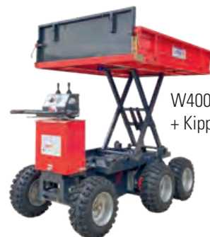
W400L Liftmodus + Kippmodus

DC 24V / 600W X 2EA / 24V-165 AH V: 5.2 km/h R: 3.2 km/h Ladefläche 120 x 90 x 20 cm Gewicht/Nutzlast 290 kg / 400 kg Art. 3119088 PREIS Fr. 8'990.-