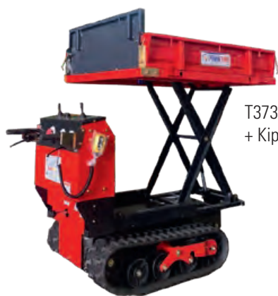
T373 Liftmodus + Kippmodus

Mit seiner Kraft auch steigendes und unebenes Gelände zu bewältigen, kann der Transporter für verschiedene Zwecke wie Industrieanlagen, Bauwesen und Landwirtschaft eingesetzt werden.