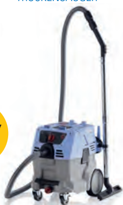
NASS- & TROCKENSAUGER