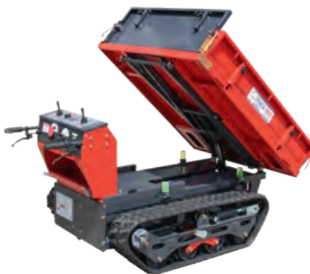
T500 Liftmodus + Kippmodus

KIT ERHÖHUNG LADEBRÜCKE Art. 3121737 PREIS FR. 144.-