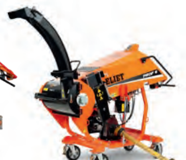
PROF 6 PTO