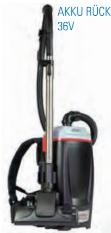
AKKU RÜCKENSAUGER 36V