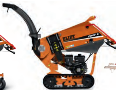
PROF 6 CROSS COUNTRY