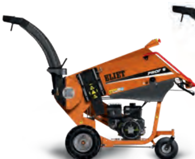
PROF 6 ZR