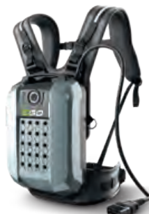
BAX1501 Kit *inkl. Adapter und Rucksack Fr. 1'850.-