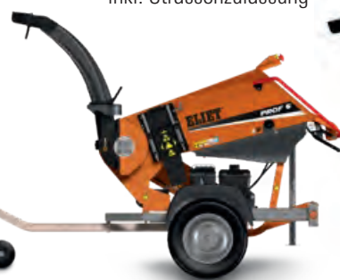
PROF 6 ON ROAD