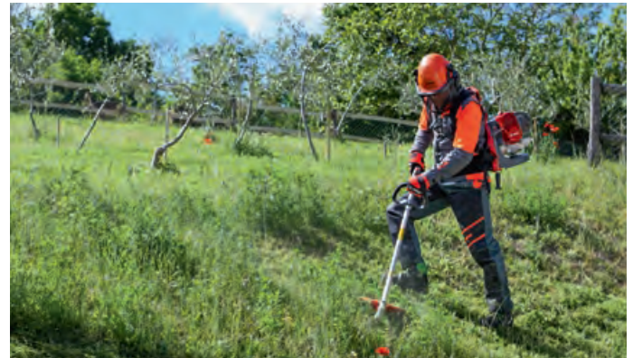
MULCHER / GESTRÜPPMÄHER